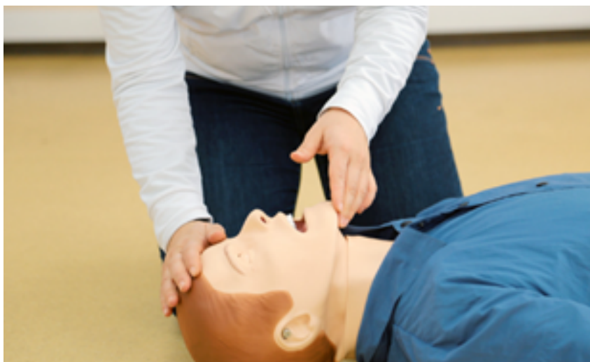
1. att. Galvas atgāšana, lai pārbaudītu elpošanu vai veiktu elpināšanu

Atbrīvo cietušā elpceļus, atliecot viņa galvu un paceļot apakšžokli.