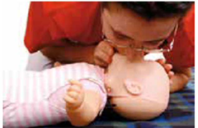
4. att. Mutes pozīcija mākslīgās elpināšanas laikā bērnam un zīdaiņim