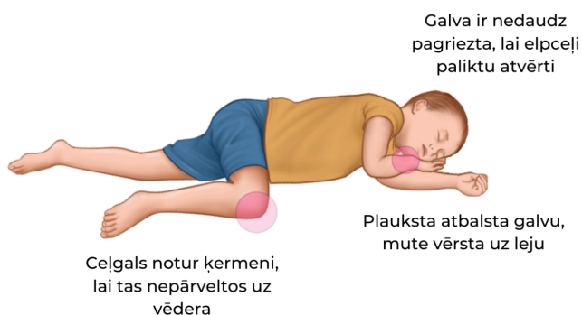
3. att. Stabila sānu poza

Ja bērns elpo pietiekami (vismaz divas un vairāk elpošanas reizes 10 sekunžu laikā), novieto bērnu stabilā sānu pozā (sk. 3. attēlu).