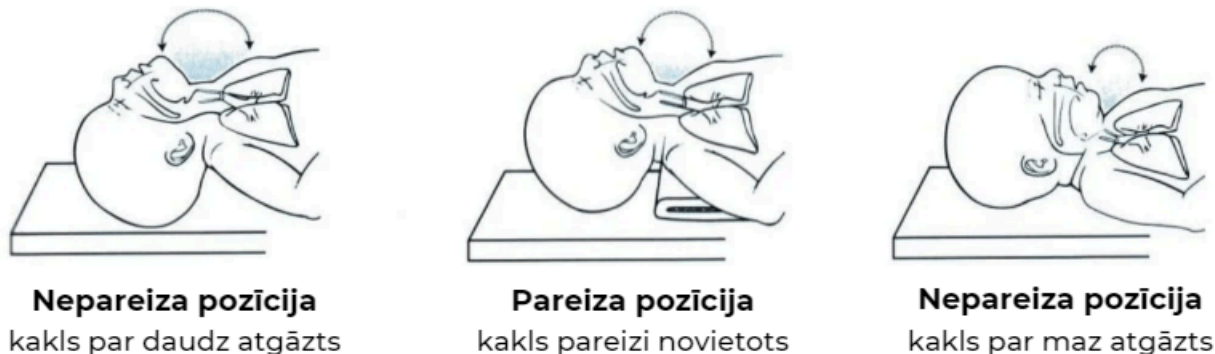
2. att. Pareiza kakla pozīcija elpceļu atbrīvošanas laikā

Pārlicinies, ka bērna galvas un kakla pozīcija ir pareiza (sk. 2. attēlu).